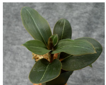
Ludisia discolor var ambrosia