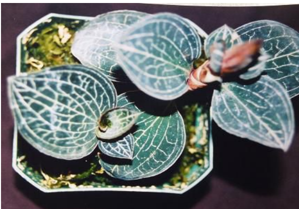
銀線蓮 ( A. koshunensis )