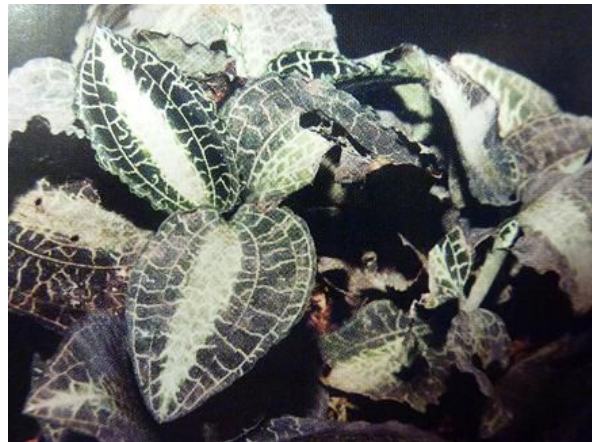
銀線開唇蘭 ( A. albolineatus )